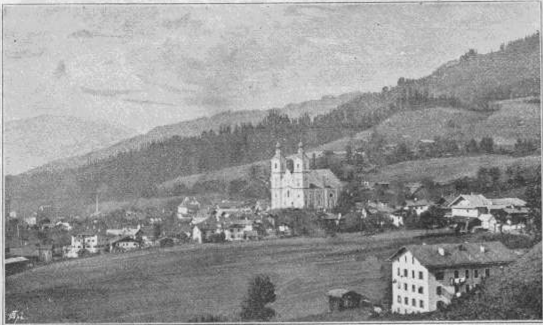
Hopfgarten gegen Nordwest.

Es handelt sich hier um den Blick vom ehemaligen Altersheim mit angeschl. Entbindungsstation (heute Pension Margaretha bzw. Rondell). Der Betrachter sieht auch noch das unverbaute Höger-Feld (es fehlen die Forstverwaltung, Hotel Hopfgarten, Salvena, Sportresort Hopfgarten etc.).