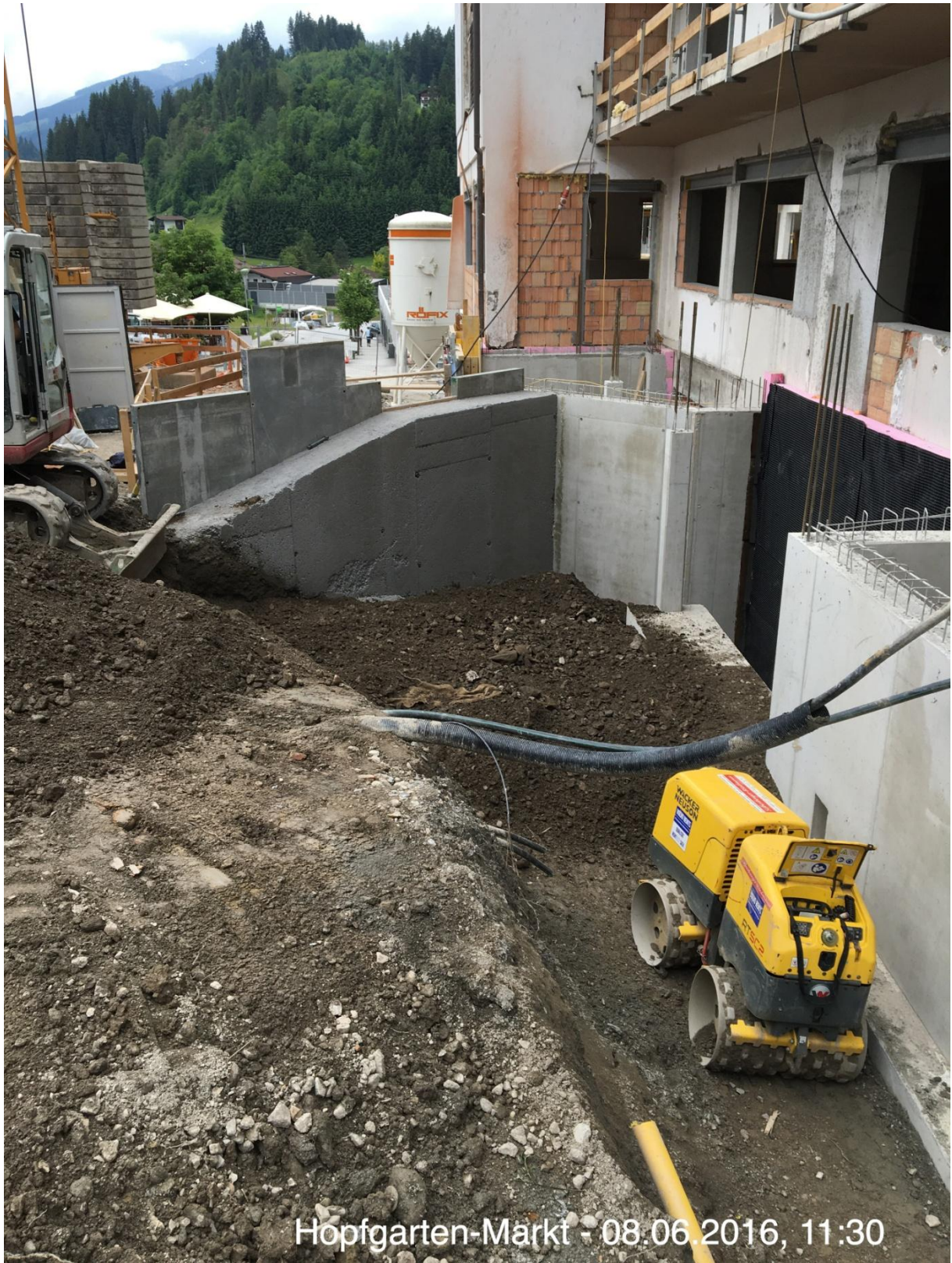
Hopfgarten-Markt - 08.06.2016, 11:30