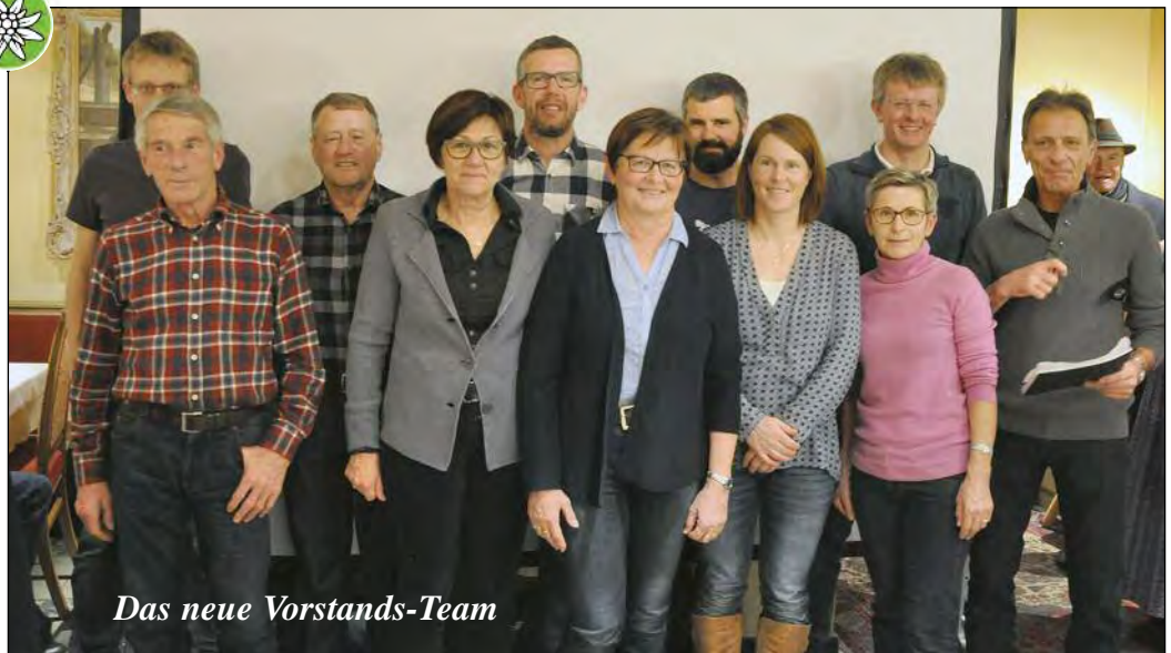
Das neue Vorstands-Team

Die Tourenführer der einzelnen Gruppen ließen mit Fotos die Highlights des Jahres 2016 Revue passieren. Etliche Touren wurden sehr gut angenommen, vor allem die Gruppe „Extrem Gmätlich“ konnte von teilnehmerstarken Aktionen berichten. Mehrere Vortragende appellierten angesichts eines am selben Tag auf der Hohen Salve stattgefundenen Lawinenunfalls an verantwortungsbewusstes Verhalten im Hinblick auf Sicherheit und Umgang mit der Natur.