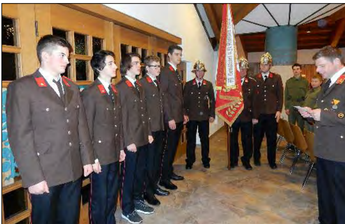
Feierliche Angelobung der fünf jungen Kameraden