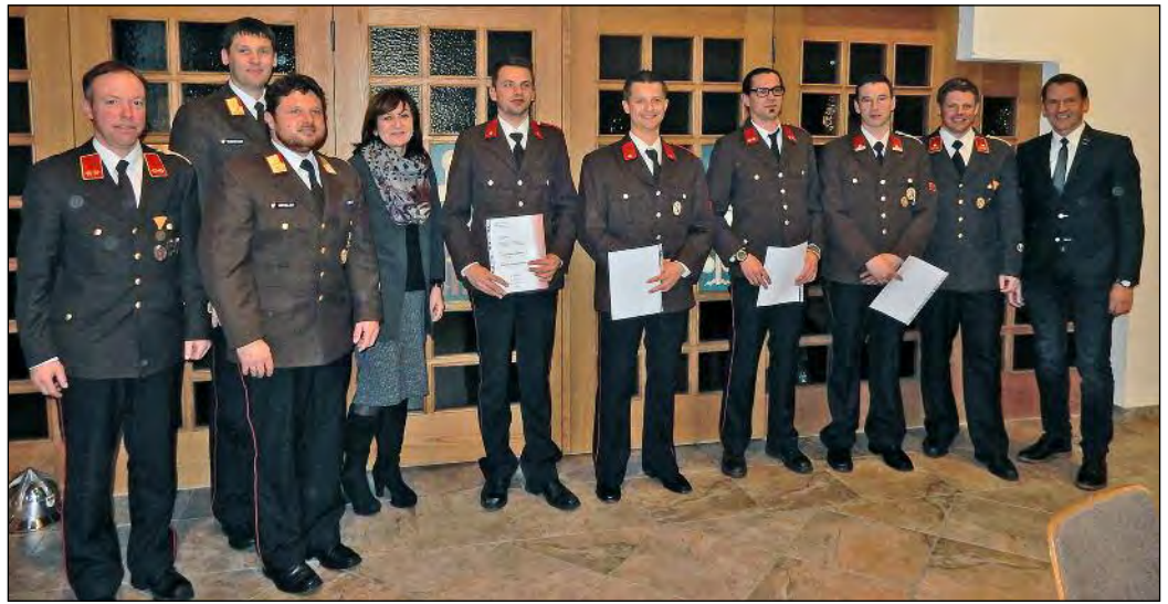
Gruppenfoto der Beförderten